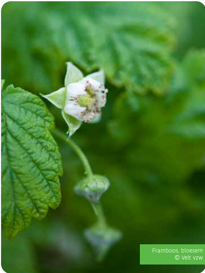
Framboos, bloesem