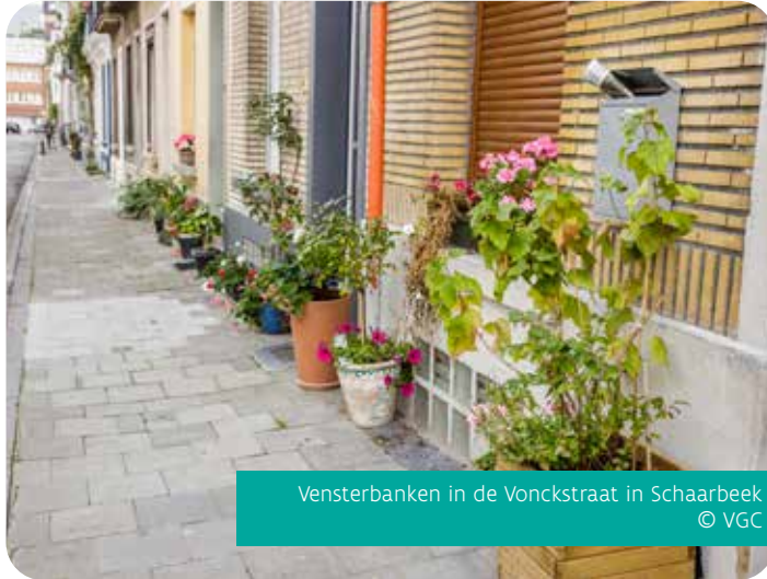
Vensterbanken in de Vonckstraat in Schaarbeek

Zelfs zonder toegang tot volle grond kun je eetbaar groen kweken in de openbare ruimte. Op sommige locaties krijg je geen toestemming om openbaar terrein te vergroenen (bijvoorbeeld voor de toegankelijkheid van het voetpad) of is er weinig of geen buitenruimte. Je kunt dan misschien wel bloemen in potten en bakken op een balkon of op de vensterbank zetten. Als je je vooraf goed informeert, kun je ook bewust omgaan met water en andere grondstoffen als je bloemen teelt in potten.