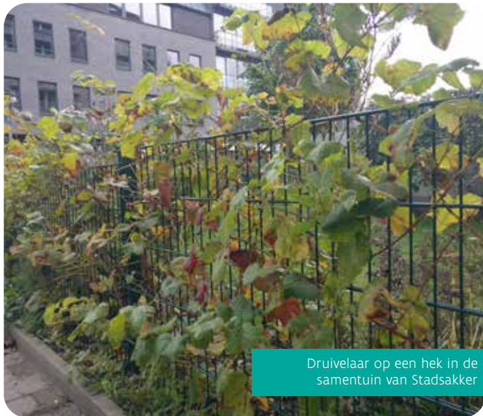
Druivelaar op een hek in de samentuin van Stadsakker

Een hek kan dienen als steun voor planten. Logisch is dan ook dat je kiest voor lei- of klimfruit. Ook sommige bessen zoals frambozen en bramen hebben graag wat steun en kun je aan een hek binden. Of je kiest ervoor om alles te combineren en een sneukelhaag langs het hek te vormen met laagstam-, klim- en leifruit en bessen.